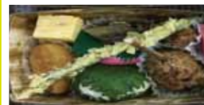
「しんごろう」や「しんごの山椒漬」など会津の郷土料理が入った内容です。

本商品には、お食事が付いておりません。会津鉄道・会津田島駅の名物「おふくろ弁当」を別途1,100円(税込)で承ります。ご希望のお客様は、ホームページをご覧ください。 ※7月2日まで ※会津川口駅周辺の食堂は限られています。